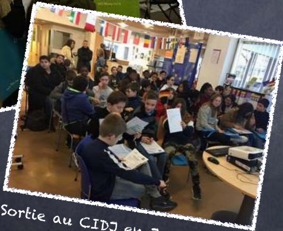
Sortie au CIDJ en Janvier 2020