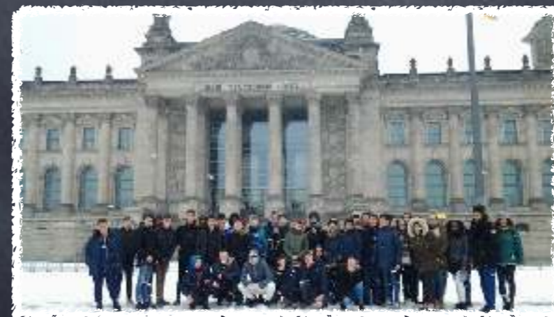
Voyage à Berlin 2019

N'hésitez pas à aller sur le site du collège pour en voir plus !!