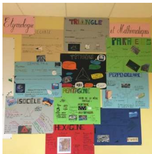
le mur d'affichage en C8

Les réalisations sont colorées. Elles sont désormais affichées sur les murs de salle C8 et profitent à tous les élèves de passage.